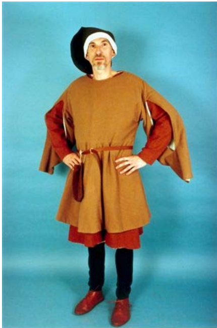
Borghese, ceto medio alto