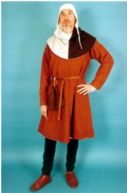
Mercante, ceto medio basso