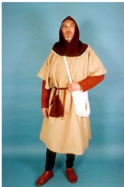
Artigiano, ceto medio basso

A completamento dell'abbigliamento il nostro uomo indossa una GUARNACCA, la guarnacca è, usando un termine moderno un vero e proprio "cappotto" ampio, con maniche, lunga fino alle ginocchia. Essa s'indossa allacciandola sul davanti con lacci di pelle o tessuto oppure infilandola dalla testa. Questo soprabito, rispetto agli altri è caratterizzato dagli ampi tagli verticali praticati sulle maniche all'altezza dei gomiti, onde far passare le braccia lasciando le maniche pendenti all'indietro, i tagli, in un'altra versione forse più comune, sono praticati frontalmente all'altezza delle spalle, sopra le ascelle.