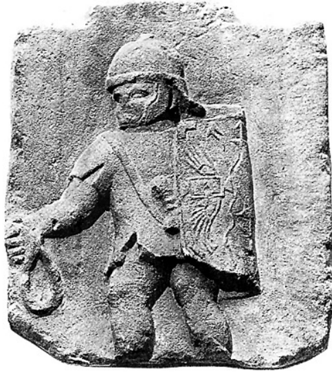
Bassorilievo di un velite (fante leggero) romano armato di fionda. Roma, Museo della Civiltà romana.

Un testo di epoca basso-imperiale attribuito a Onasandro, lo Strategikhòs («Il generale»), testimonia il notevole valore attribuito alla frombola, considerata addirittura superiore all'arco stesso: «La fionda è l'arma più micidiale come arma da getto usata dalle truppe leggere, dato che il proietto di piombo ha lo stesso colore dell'aria ed è invisibile nella sua traiettoria, cosicché si abbatte inaspettato sui corpi non protetti del nemico, e non solo l'impatto in sé è violento, ma il proietto, riscaldato dall'attrito nel suo volo attraverso l'aria, penetra molto profondamente nella carne, così da divenire persino invisibile, e il rigonfiamento si richiude rapidamente su di esso» (XIX).