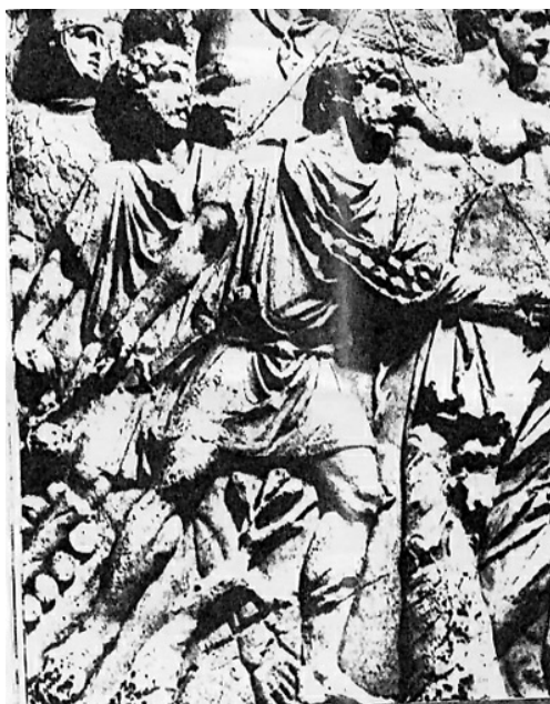
Frombolieri romani, probabilmente ausiliari barbari. Da notare i sassi tenuti in una piega del mantello.

L'efficacia della fionda, insieme con la sua economicità e la semplicità di impiego, non sfuggì ai generali dell'età imperiale: durante la guerra civile contro Cesare, l'esercito di Pompeo disponeva di due coorti di frombolieri ( funditores ) di 600 uomini ciascuna; contemporaneamente le prestazioni dell'arma erano state migliorate scagliando non solo semplici sassi, ma anche proietti di terracotta indurita o di piombo, di forma ovoidale o biconica ( glandae o glandulae ), sui quali non di rado si trovavano impressi il numero della coorte, oppure parole di scherno e sfida tipo «Mangia», «Prendi», «A te» ecc.