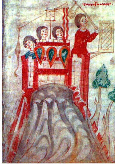
Fromboliere armato di fustibalo a difesa di una torre. Miniatura, inizi XIII secolo. Pietro da Eboli, Liber ad honorem Augusti, f. 111 recto, particolare. Berna, Burgbibliothek.

La gittata di un fustibalo può essere valutata ampiamente oltre i 100 metri, specie se il tiratore si trovava in posizione elevata: nel folio 111 recto del Liber un tiratore armato di fustibalo compare in cima a una torre difesa anche da un mangano; la merlatura sembra rinforzata con un graticcio sporgente, forse di vimini intrecciati.