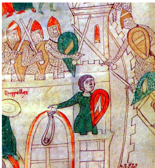
Fromboliere sulle mura di Salerno assalita dalle truppe imperiali. Miniatura, inizi XIII secolo. Pietro da Eboli, Liber ad honorem Augusti, f. 132 recto, particolare. Berna, Burgbibliothek.

Presto, però, Enrico VI ritornò in forze, e i riottosi salernitani si videro costretti a subire a loro volta l'assalto delle truppe imperiali al comando del conte Diopoldo di Vöhhburg: nel folio 132 recto i tedeschi si arrampicano con scale sulle mura della città, contrastati da difensori muniti anch'essi di elmo e usbergo di maglia di ferro, mentre, su una torre, un fromboliere è in procinto di scagliare il suo proiettile contro gli attaccanti. Di grande interesse il sistema di sgancio dell'arma, chiaramente visibile e costituito da un semplice occhiello all'estremità di uno dei lacci, nel quale il tiratore ha inserito l'indice della mano destra. Sia in questa, sia nella precedente miniatura i frombolieri non indossano armamenti difensivi, limitandosi a proteggersi con uno scudo «a mandorla» di tipo normanno.