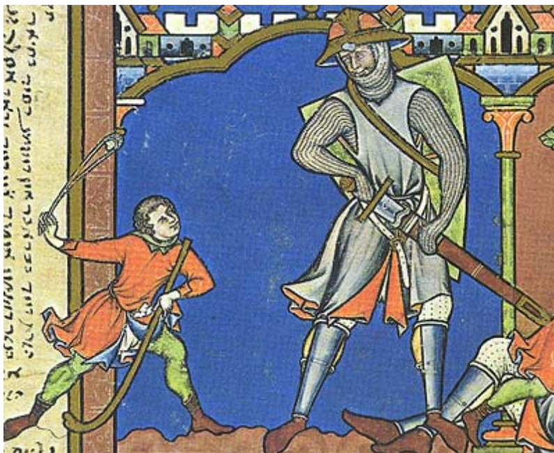
Davide uccide Golia con la frombola. Miniatura, 1250 circa. Bibbia Maciejowski, f. 28 verso, particolare. New York, Pierpoint Morgan Library.

Il più celebre in assoluto di tutti i frombolieri è da sempre Davide, che abbatté il gigante Golia semplicemente colpendolo in fronte con un sasso di fiume scagliato dalla sua fionda (I Sam 17, 48); la scena, largamente rappresentata nelle miniature dei codici, costituisce una costante dell'iconografia medievale.