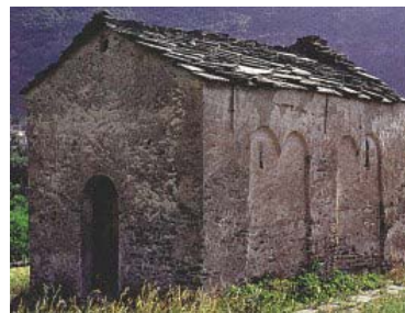
Cappella di Santa Maria.