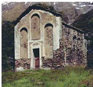
Cappella di San Michele

Il fulcro dell'abbazia è incentrato sulla chiesa dei santi Pietro ed Andrea costruita secondo canoni barocchi fra il 1712 ed il 1715, ma grande fascino rivestono le piccole quattro cappelle isolate ed esterne all'abbazia, edificate nei prime decenni del sec. VIII dedicate a Santa Maria, San Michele, San Salvatore e Sant'Eldrado.