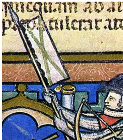
Maciejowski Bible XIII secolo

Fino al XIII secolo le insegne erano quadrangolari, con o senza coda, e a partire dal XII secolo bordate o armate. Nel XII secolo, con qualche raro caso riscontrato nei primi decenni del XIII secolo, le bandiere a coda " a queque " erano sicuramente le più utilizzate: Avevano cioè la forma di quella riprodotta sulla tappezzeria di Bayeux o di quella rappresentata su un capitello della chiesa di Vézelay cioè quadrangolare con quattro code e due attacchi all'asta, oppure a cinque punte con quattro attacchi se non con sistema ad infilaggio nell'asta. E' col XIII secolo che viene introdotta la bandiera rettangolare senza code composta di un pezzo di stoffa oblungo ed infilata, o legata in più punti, nell'asta sul lato maggiore.