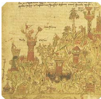
Torre con bandiera tratte dal De Bello Canapiciano XIV sec

Ci sono, ad esempio, molti scritti i quali testimoniano che Clodoveo pretendesse che sui suoi stendardi fossero dipinti dei fiordalisi; durante il periodo dei carolingi, invece in battaglia veniva esposto l'orifiamma realizzato in stoffa di Cendal, rosso bordato di fiamme dorate.