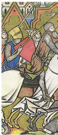
Maciejowski Bible XIII secolo

Lo stendardo della compagnia di Sant'Uberto è stato ricostruito basandosi sulle seguenti fonti :