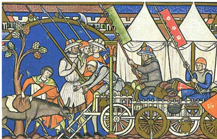
Maciejowski Bible XIII secolo

In tutta l'antichità si sono stati esposti, negli eserciti, dei segni di riconoscimento all'estremità di aste sufficientemente lunghe da poter essere viste dai combattenti. E ciò permane nel tempo.